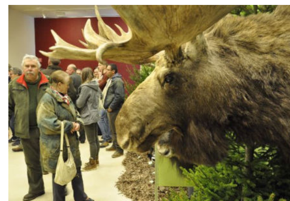
Ázsia vadvilága az Agóráb

– Számomra a színek a lélek energiáját jelentik. Nekem például nem anyag a víz, a levegő vagy a kő, hanem élő energia, mely be van sűrűsödve ebbe a világba. Ez azt jelenti, hogy a festmény sem csak képi tartalommal rendelkezik, hanem energiával, szeretet érzéssel. Megvan az az érdekes képessége egy festménynek, hogy amikor valaki előtte áll, és belemélyed, megnyitja a lelkét. Ez a titka a